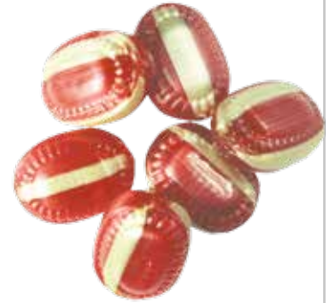
307: Glühwein gefüllt